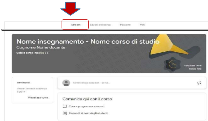
Figura 3 - sezione STREAM per visualizzare il materiale

Tutto il materiale del corso sarà immediatamente visibile nella sezione “ STREAM ” del corso (vedi Figura 3).