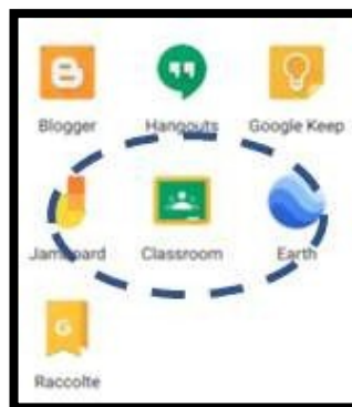
Figura 1 - Icona identificativa dell'applicazione Classroom

Per utilizzare lo strumento è necessario accedere alla propria casella di posta elettronica Gmail 1 ; quindi si deve accedere al menu di google e cliccare su CLASSROOM (Figura 1). In alternativa, dopo aver effettuato l'accesso con le proprie credenziali di posta, è possibile accedere all'applicazione CLASSROOM direttamente dal link https://classroom.google.com/ .