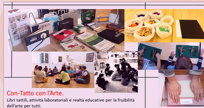
Con-Tatto con l'Arte.

Libri tattili, attività laboratoriali e realtà educative per la fruibilità dell'arte per tutti.