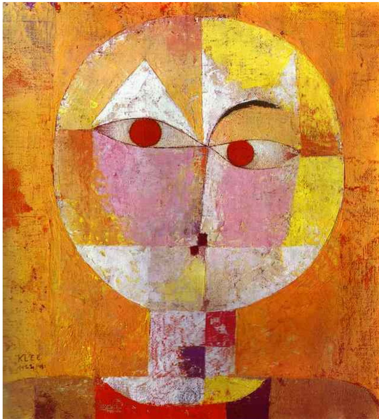
Paul Klee - Senecio - Kunstmuseum