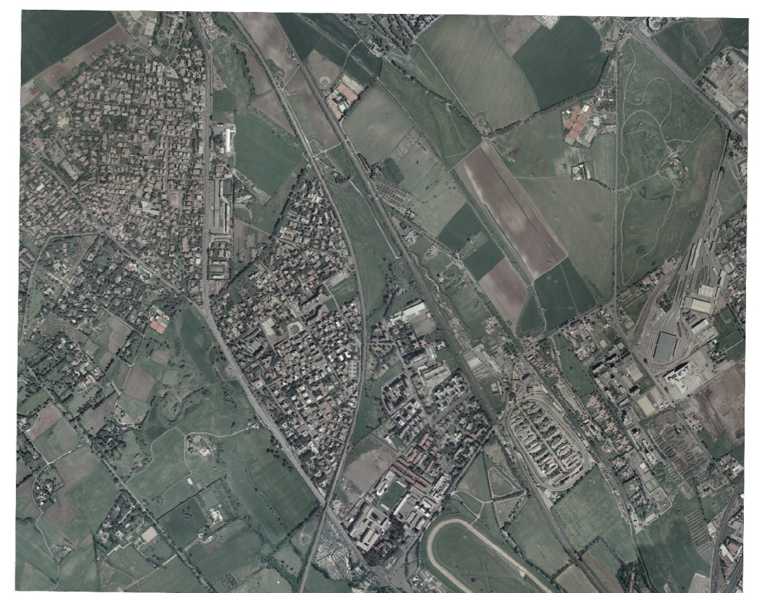
ORTOFOTO Scala 1 : 25000

Volo del 2002 di proprietà della Regione Lazio Restituzione del 2005