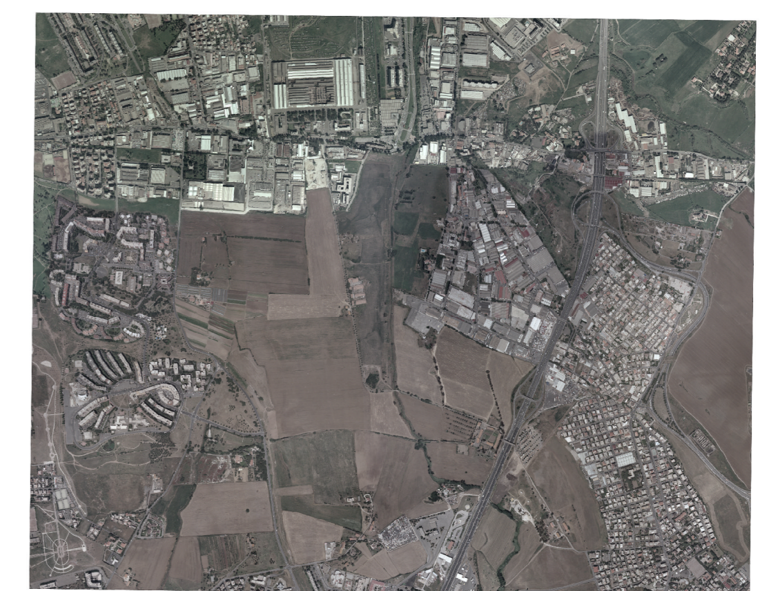
ORTOFOTO Scala 1 : 25000

Volo del 2002 di proprietà della Regione Lazio Restituzione del 2005