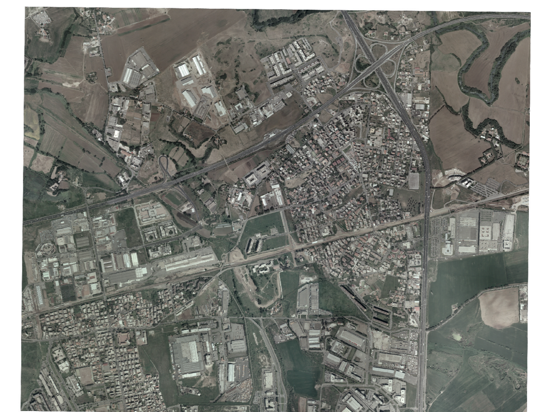
ORTOFOTO Scala 1 : 25000

Voce del 2002 di proprietà della Regione Lazio Restituzione del 2005