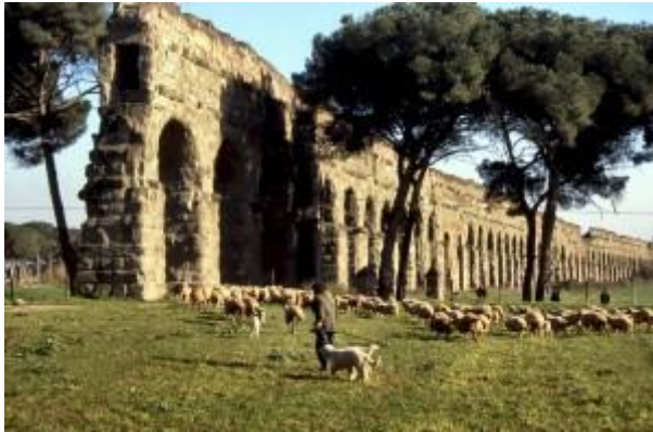
Roma, Parco degli acquedotti