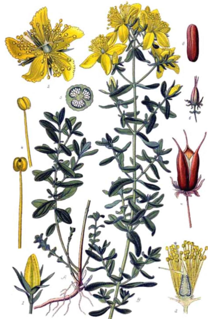
Pl. 61. Millepertuis perforé. Hypericum perforatum L.