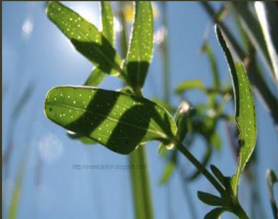
Foglie di Iperico osservate in controluce