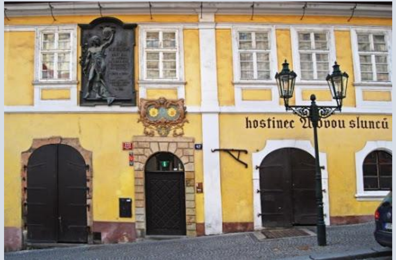
Da ragazzo Jan Neruda abitava in via Ostruhová (oggi Nerudova) nella casa con l'insegna dei Due Soli.