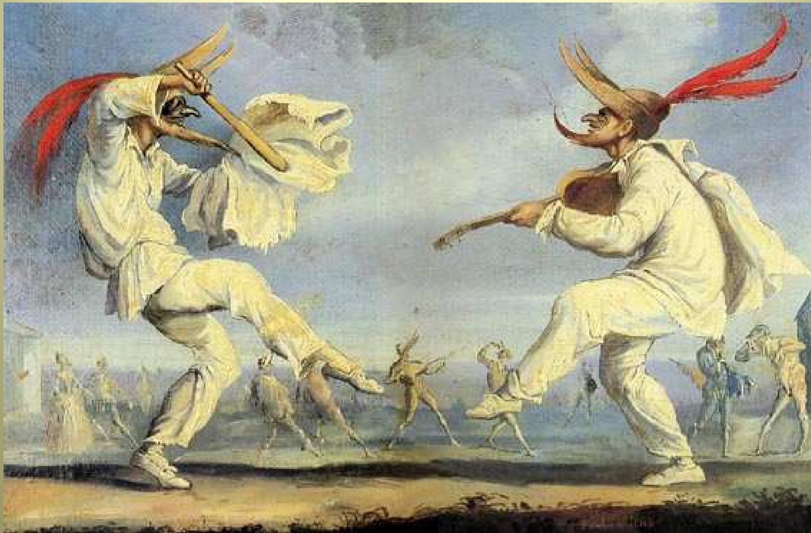
Lazzi di Pulcinelli