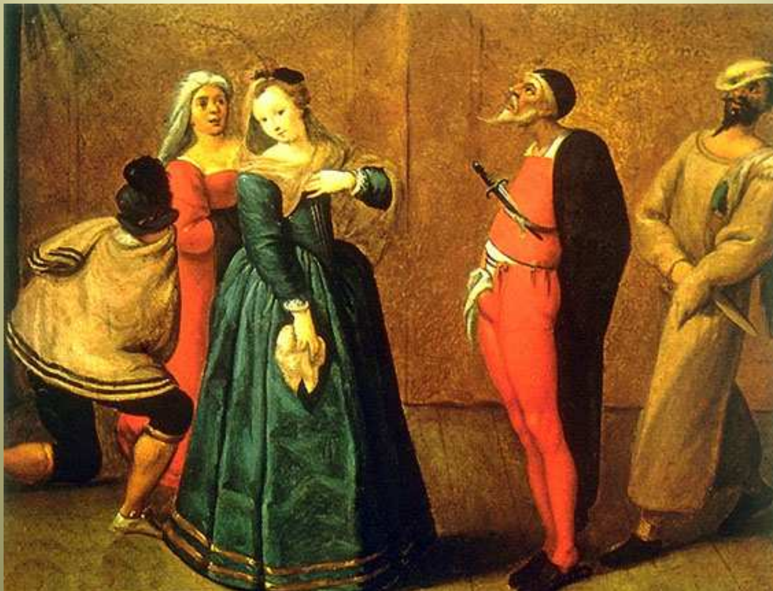
Personaggi delle commedie italiane dell'Arte dipinto francese del XVI secolo, Parigi, Museo Carnevalet