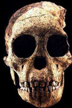
Australopithecus africanus Taung