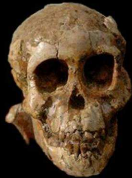
Australopithecus afarensis Dik-1-1