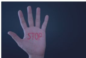
Antigypsyism / Discrimination