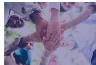
Roma youth / Children