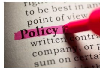
Policy / Strategy developments and implementation