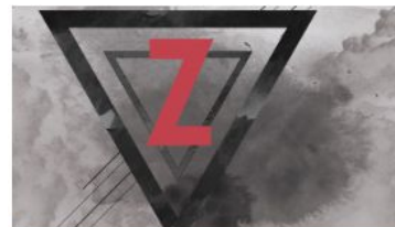
Roma History / Holocaust