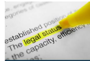
Legal status / Identity documents / Statelessness