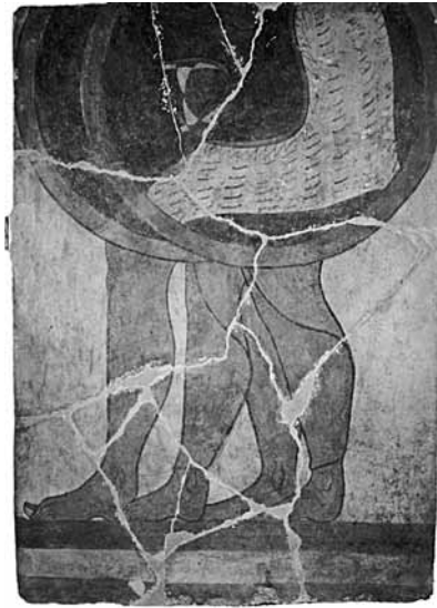
Fig. 7. Lastra fittile ceretana conservata al Museo di Cerveteri (da Proietti 1986).