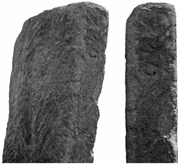
Fig. 9. Retro della stele di Kaminia.

ACHILLI A. et al. 2007. Mitochondrial DNA Variation of Modern Tuscans Supports the Near ea-