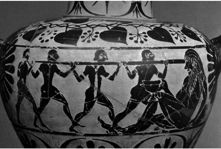
Fig. 12. Hydria ceretana con compagni di Odisseo che accecano Polifemo: particolare (da Proietti 1986).

stern Origin of Etruscans , in The American Journal of Human Genetics 80, pp. 759-768.