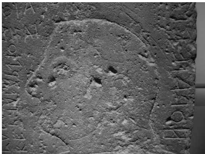
Fig. 5. Particolare della stele di Kaminia.

fregio monumentale a bassorilievo che si snodava verso destra su più elementi. La struttura e il montaggio dell'ipotizzato dispositivo monumentale sarebbero identici a quelli ricostruiti per le lastre fittili ceretane, crustae parietali a tutti gli effetti, per cui si è proposto un impiego come rivestimento decorativo di pareti di ambienti interni con funzioni rappresentative 163 . Nella fattispecie, le lastre fittili di Cerveteri e Copenhagen – (Figg. 7-8), con guerrieri stanti muniti di scudo circolare, offrono un buon termine di confronto: in un caso (Fig. 7) la rappresentazione è perfettamente centrata rispetto ai bordi del pannello, nell'altra (Fig. 8) le lacune non consentono di stabilire in via definitiva se lo scudo del secondo guerriero era disegnato su due pannelli adiacenti. Quel che se ne può dedurre – in ogni modo – è che l'artigiano in questi casi effettuava calcoli precisi prima di intervenire con il compasso e solitamente 'centrava' la rappresentazione, a meno che non avesse a disposizione uno spazio scandito modularmente, su cui poteva eventualmente dilatare il disegno 164 .