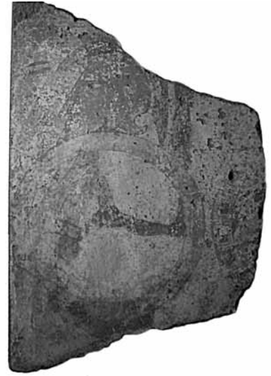
Fig. 8. Lastra fittile ceretana conservata alla Ny Carlsberg Glyptotek di Copenhagen (da Christiansen-Winter 2010).

pelle o in tessuto, che sanerebbe un'altra anomalia della rappresentazione: l'assenza di un elmo di tipologia nota e la mancata notazione della capigliatura, lasciata liscia. Si tratta in effetti di un caso di resa grafica involontariamente ambigua, non infrequente in rappresentazioni come la nostra in cui prevale un impianto puramente disegnativo, che ricorda non a caso le rese di capigliature definite come "close-fitting helmets" 170 in opere plastiche e come "bathing-cap(s)" in opere pittoriche 171 (Fig. 12). Nel nostro caso tuttavia ci sentiremmo di escludere che si tratti di un semplice stilema allusivo di una capigliatura, perché, pur nella sua semplicità, la forma della testa rimanda effettivamente a qualcosa di indossato, come supposto anche da altri. Tale copricapo, complementariamente alla lancia, concorre a identificare il personaggio come una personalità di spicco della comunità tirrenica di Lemno che aveva rivestito funzioni militari. Quand'anche il copricapo a cuffia non fosse allusivo di un qualche ruolo militare specifico, resta comunque