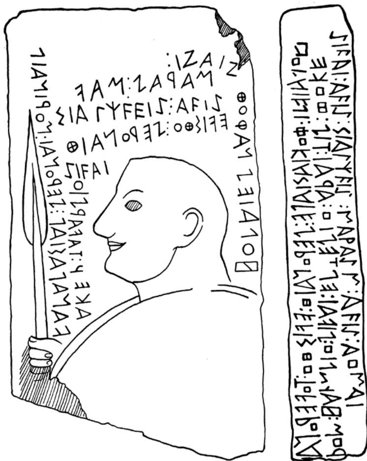
Fig. 4. Fac-simile della stele iscritta di Kaminia (da Brandenstein 1934).

viso. Vi è dunque nella composizione una forte asimmetria, rispetto alla 'cornice' immaginaria del manufatto, cui si aggiunge un altro particolare insolito, l'incompletezza dello scudo circolare – se di questo si tratta 161 – che mentre appare integro a sinistra, è ritagliato brutalmente a destra. A meno di non pensare a un goffo errore di calcolo dello scalpellino, che non avrebbe calcolato bene lo spazio a disposizione, occorre trovare per questo dettaglio una spiegazione adeguata. Non esiste, infatti, a nostra conoscenza, in nessun contesto culturale prossimo a quello indagato, un caso analogo di rappre-