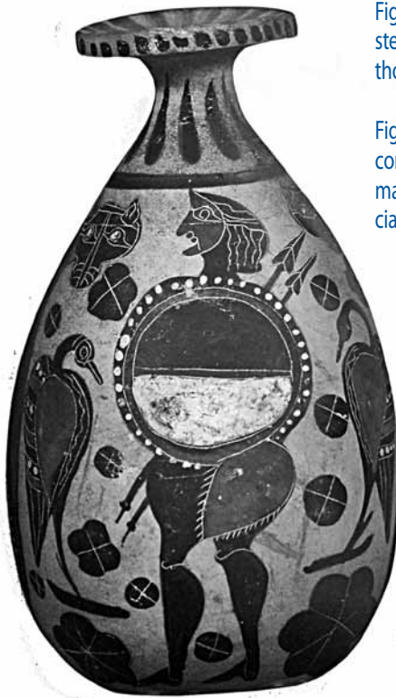
Fig. 11. Alabastron etrusco-corinzio con personaggio mascherato armato di lancia (da Giuliano-Buzzi 1992).