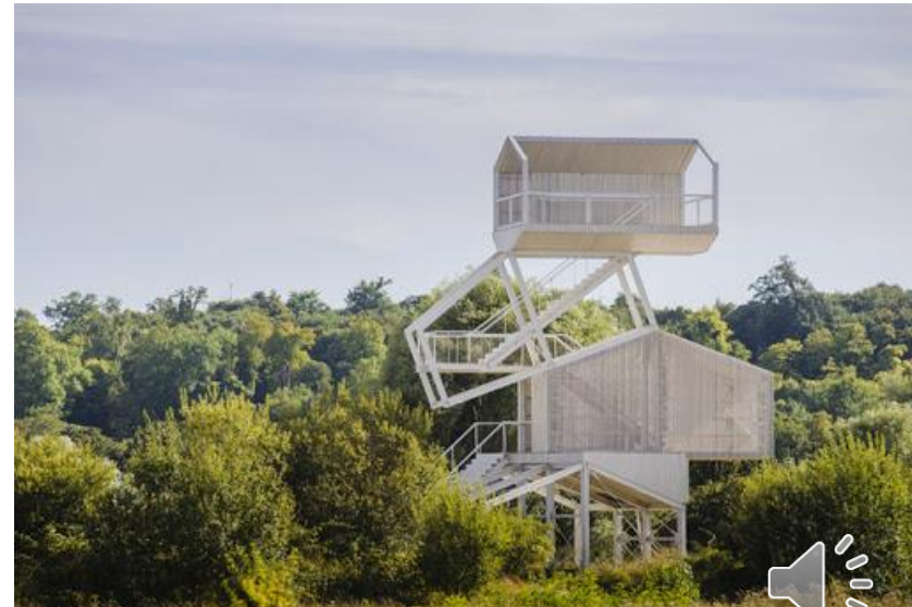
Carrières sous Poissy – Parc Peuple de l'herbe