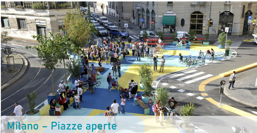
Milano - Piazze aperte