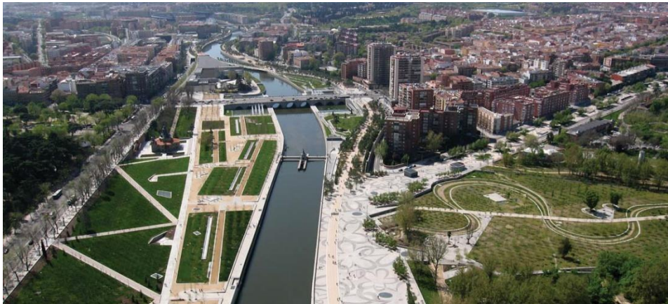
Madrid – Madrid Rio