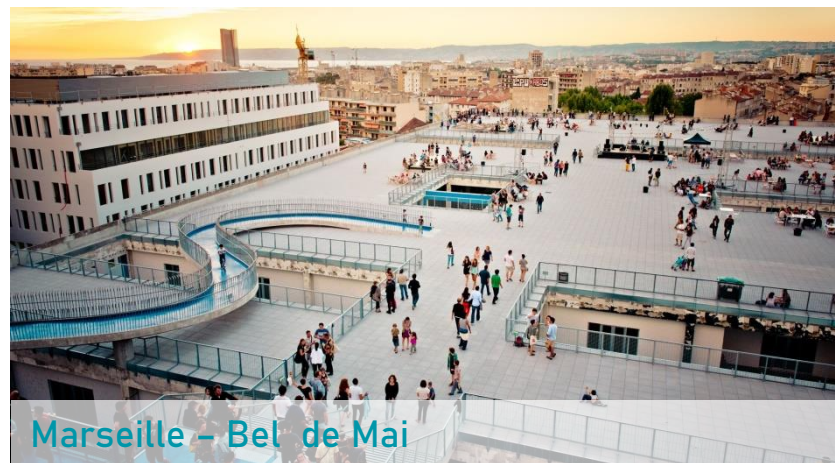
Marseille – Bel de Mai