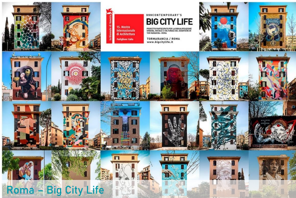
Roma – Big City Life