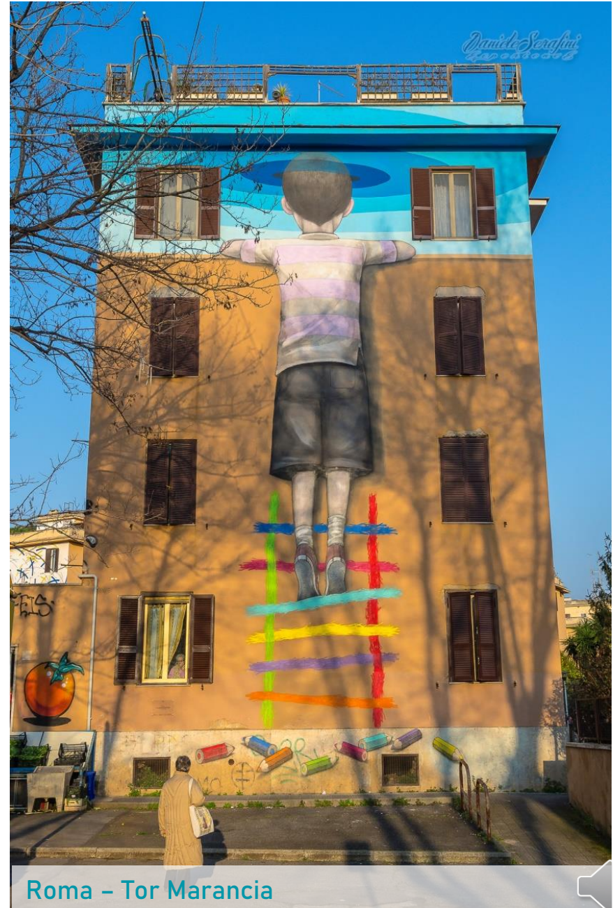
Roma - Tor Marancia