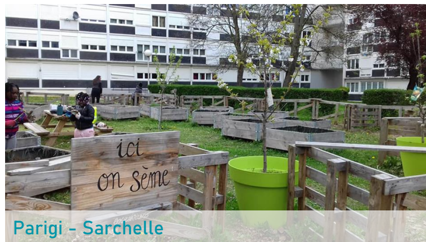
Parigi – Sarchelle