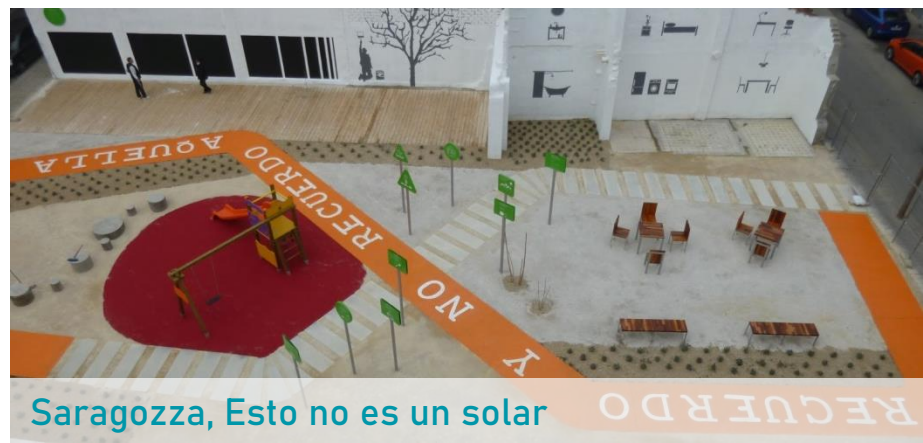
Saragozza, Esto no es un solar