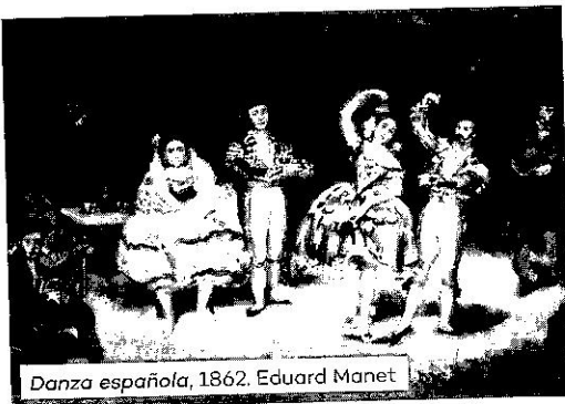
Danza española, 1862. Eduard Manet

22. Busca información sobre Manet y Sargent, y toma nota de las representaciones sobre la imagen de España en su obra.