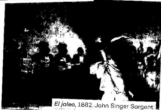
El jaleo, 1882. John Singer Sargent