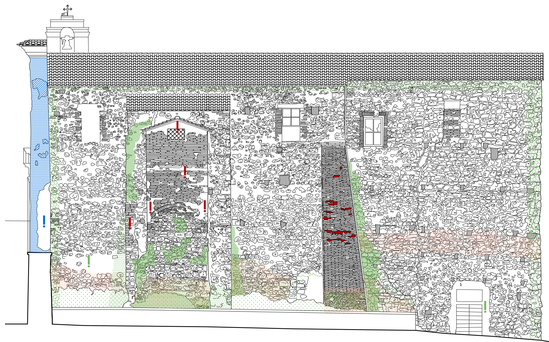
DISTRIBUZIONE PATOLOGIE PROSPETTI SUD E NORD, Scala 1:50